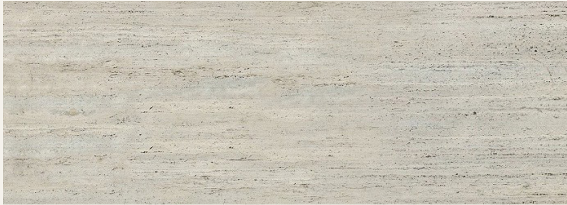
MÁRMOL TRAVERTINO BLANQUEADO