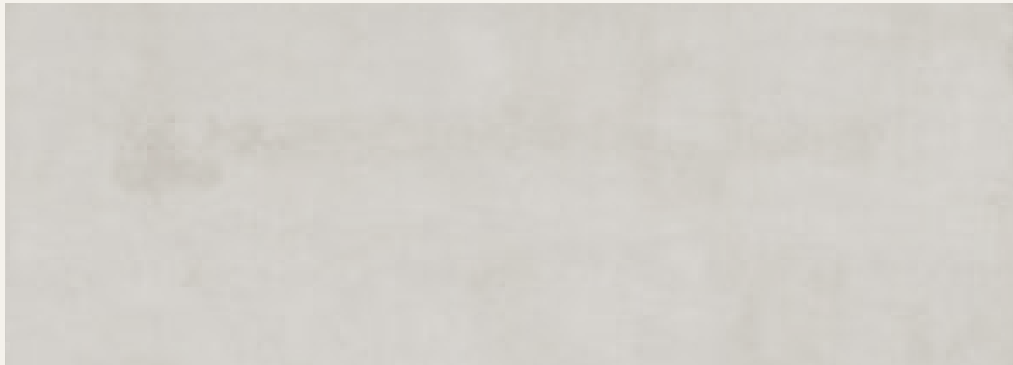
OFF WHITE STUCCO