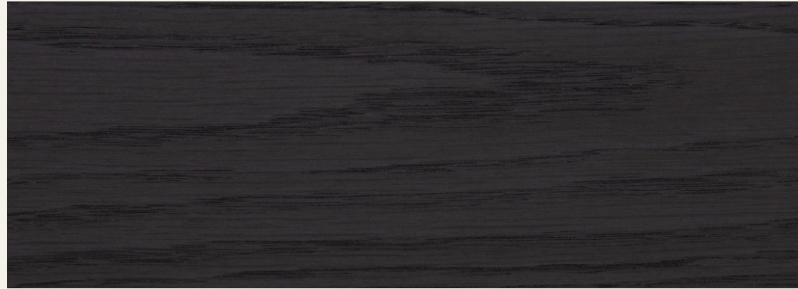
BROWN BLACK STAINED VERNEER LACQUERED WOOD