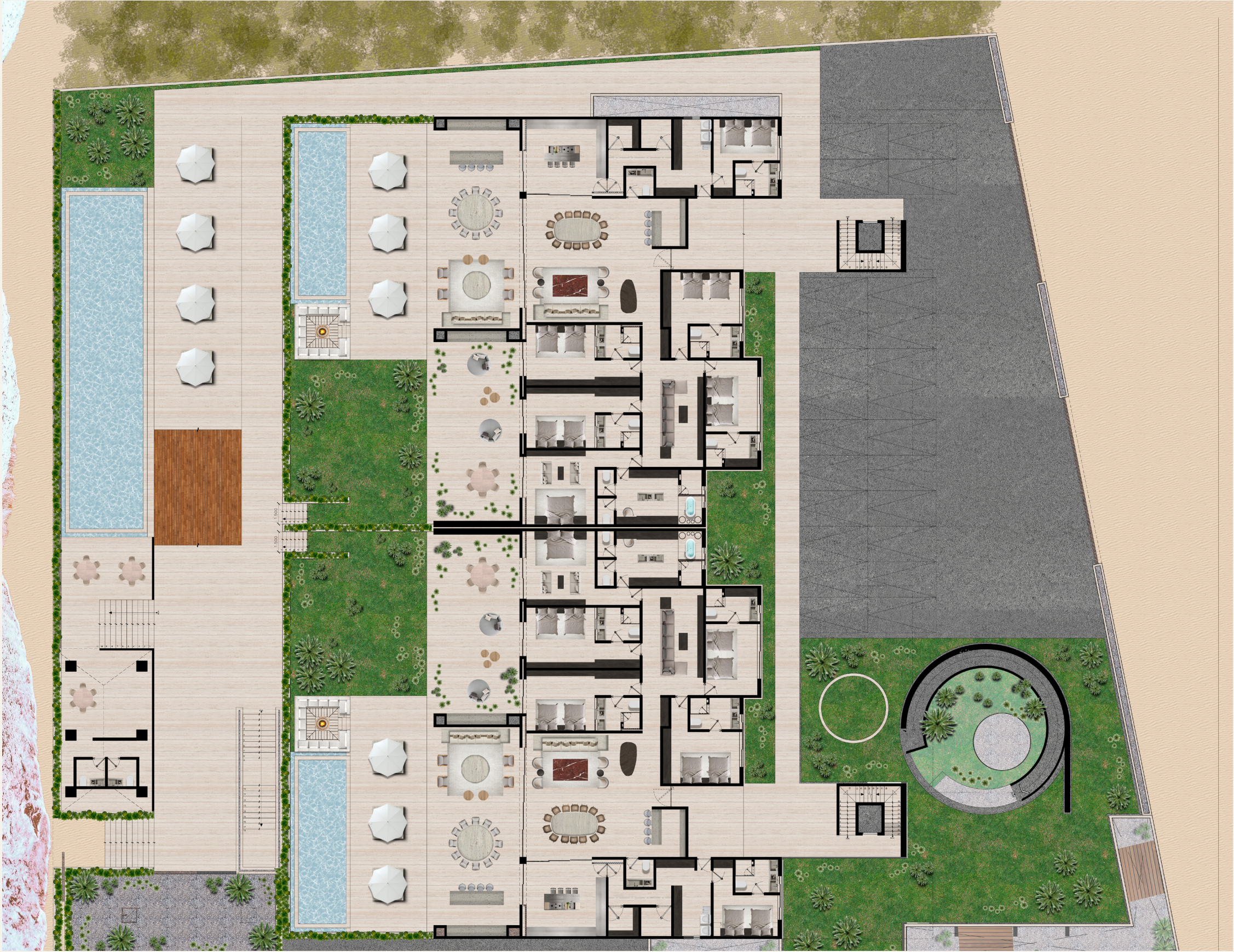
~ Planta Baja